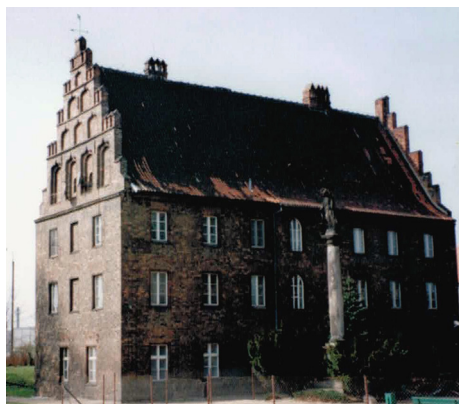
Ryc. 7.1. Budynek Psalterii od strony Ostrowa Tumskiego oraz górną część kolumny z widocznym znakiem powodzi z 1698 r. pod herbem i dolną część kolumny z kilkoma znakami