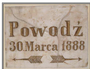
Ryc. 7.4. Budynek dawnego klasztoru ss. Szarytek na ul. Długiej 1/2; apteka Verbena oraz marmurowa tabliczka dotycząca powodzi z 1888 r.