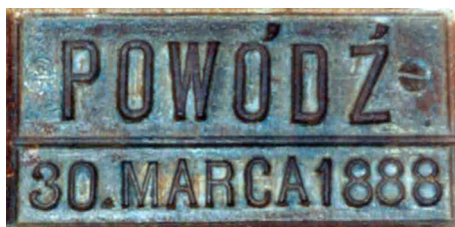
Ryc. 7.3. Kościół Bożego Ciała od strony ul. Kościuszki oraz metalowa tabliczka określająca zasięg powodzi z 1888 osadzona w wejściu od ul. Łąkowej