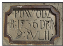
Ryc. 7.2. Kamienica Gumprechta w Poznaniu na Starym Rynku 50 oraz znak zasięgu powodzi z lipca 1736 r.: położenie znaku i jego widok

dzzonego pomiarem wymienionego już geometry Boschana, kulminacja tego wezbrania znajdowała się na rzędnej około 60,70 m n. NN i taką rzędną preferuje Kaniecki (2004, s. 445). Natomiast Paślawski (1956), przytaczając H. Kellera (publikacja z 1898 r.), pisze, że „stan wody... osiągnął 1130 cm nad dzisiejszym zerem wodowskazu przy moście Chwaliszewskim”, to znaczy rzędną 60,75 m n. NN. Do oznaczenia omawianego wezbrania letniego z 1736 r. na projektowanych w konkursie znakach wód wielkich przyjęto ostatecznie właśnie rzędną 60,75 m n. NN.