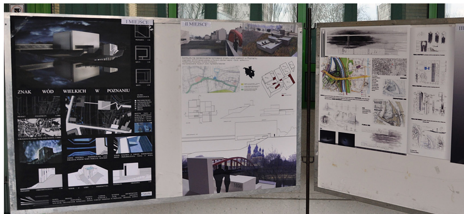
Ryc. 7.6. Wystawa nagrodzonych prace na Uniwersytecie Przyrodniczym w Poznaniu (17–24.03.2014). Od lewej kolejno I, II i III nagroda