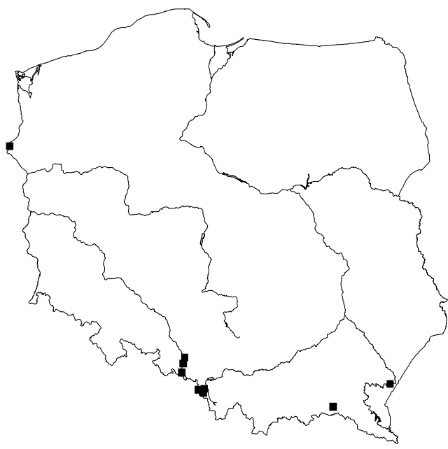
Ryc. 2. Rozsiedlenie Aleurochiton acerinus HAULT w Polsce