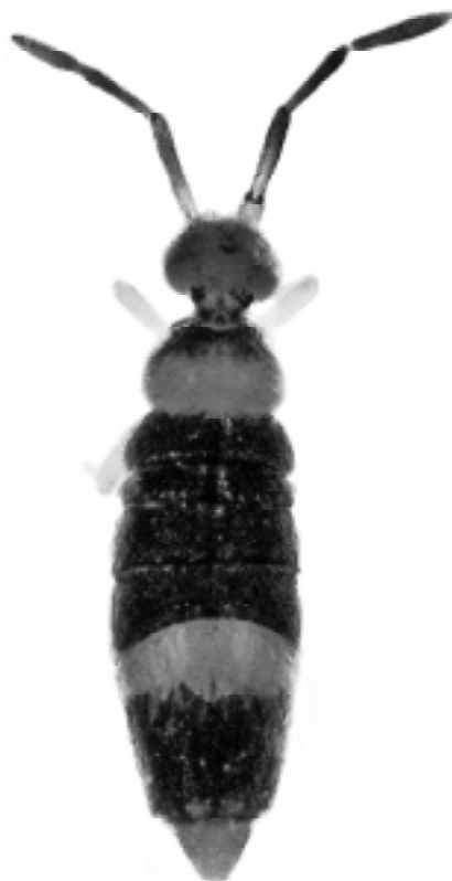
Fot. (Phot.) 1. Entomobrya albocincta (TEMPLETON, 1835)

wzniesień i wąwozów. Gatunek mniejszy niż większość przedstawicieli tego rodzaju, o wyróżniającym się wzorze barwnym, nie do pomylenia z żadnym innym gatunkiem. Charakteryzuje się obecnością pojedynczej plamy ciemnego barwnika, obejmującej II i III segment tułowia oraz I i II segment odwłoka, otoczonej białą pozbawioną barwnika linią, z biało ubarwionymi szczecinami, biegnącą grzbietobocznie od II segmentu tułowia aż do zamknięcia się na tylnej krawędzi II segmentu odwłoka (Fot. 2, 3). Pozostała część ciała z wyjątkiem nóg, widełek skokowych, ostatnich czterech członów czułków i dwóch białych kępek szczecin na tylnobocznej krawędzi IV segmentu odwłoka jest zabarwiona ciemnym pigmentem. Młode osobniki są słabiej wybarwione, nie występuje jeszcze pojedyncza ciemna plama na tułowiu i przedniej części odwłoka. Samiec tak samo ubarwiony jak samica.