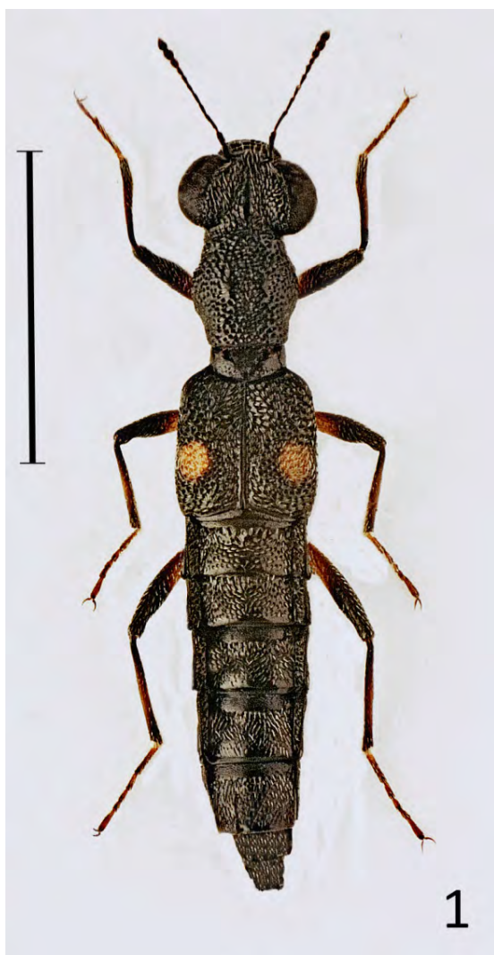
Ryc. 1. Stenus maculiger WEISE, 1875: samica (skala = 2 mm)

matowe, a na przedpleczu brakuje bruzdy środkowej. Ponadto obydwa gatunki różnią się budową aparatu kopulacyjnego samca (SZUJECKI op. cit.).