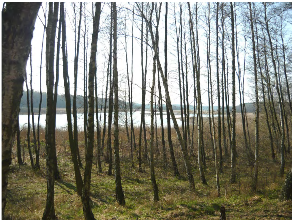
Fot. 1. Jezioro Sycyńskie – widok od strony wschodniej Phot. 1. Sycyńskie Lake – view from the east