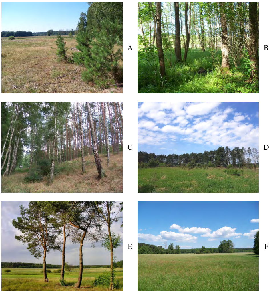
Fot. 2. / Phot. 2. Wybrane powierzchnie badawcze / Selected research area: A – pow. 1; B – pow. 2; C – pow. 4; D – pow. 7; E – pow. 8; F – pow. 10