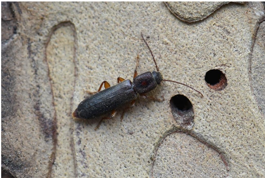
Ryc. 2. Nothorhina punctata (FABRICIUS, 1798)