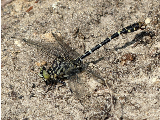
Ryc. 1. Smaglec ogonokleszcz ( Onychogomphus forcipatus ), Lublin, 6 IX 2025 r.