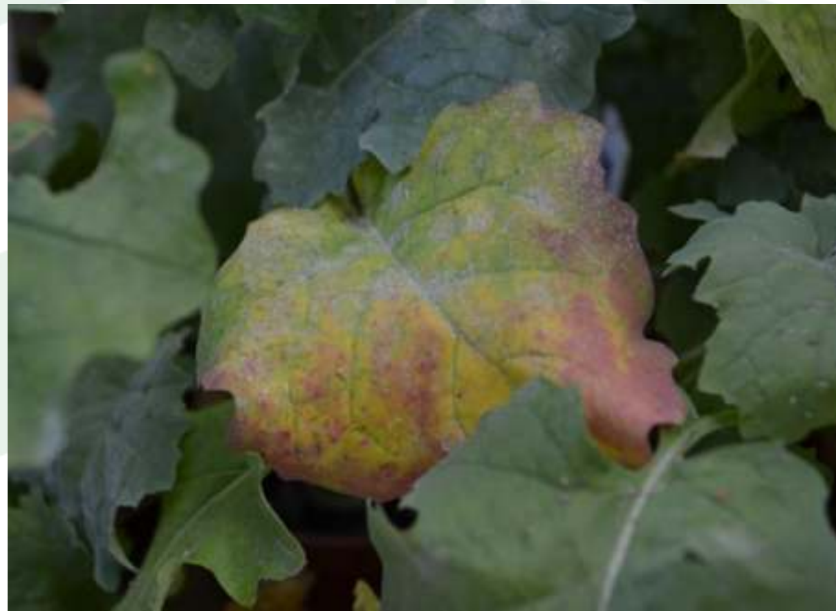
Fot. 1 Objawy porażenia przez TuYV

W ostatnich latach na plantacjach rzepaku ( Brassica napus L.) obserwuje się coraz większą aktywność wirusa żółtaczkii rzepy (TuYV). Obecność wirusa obserwowana jest w krajach: Europy, Azji, Ameryki Północnej i Australii. Choroba rozprzestrzenia się w wyniku żerowania wektorów owadzich, głównie: mszycy brzoskwiniowo-ziemniaczanej ( Myzus persicae ), mszycy ziemniaczanej ( Macrosiphum euphorbiae ) i mszycy kapuścianej ( Brevicoryne brassicae ). W wyniku porażenia rzepaku przez TuYV, straty w plonie nasion mogą sięgać nawet do 70%. Dotychczas opisane źródła odporności, pochodzą z linii resyntetyzowanej rzepaku R54 oraz jarej koreańskiej odmiany Yudal. W 2021 roku, w IHAR-PIB, Oddział w Poznaniu podjęto badanie odporności nowych materiałów wyjściowych rzepaku pod kontem odporności na TuYV.